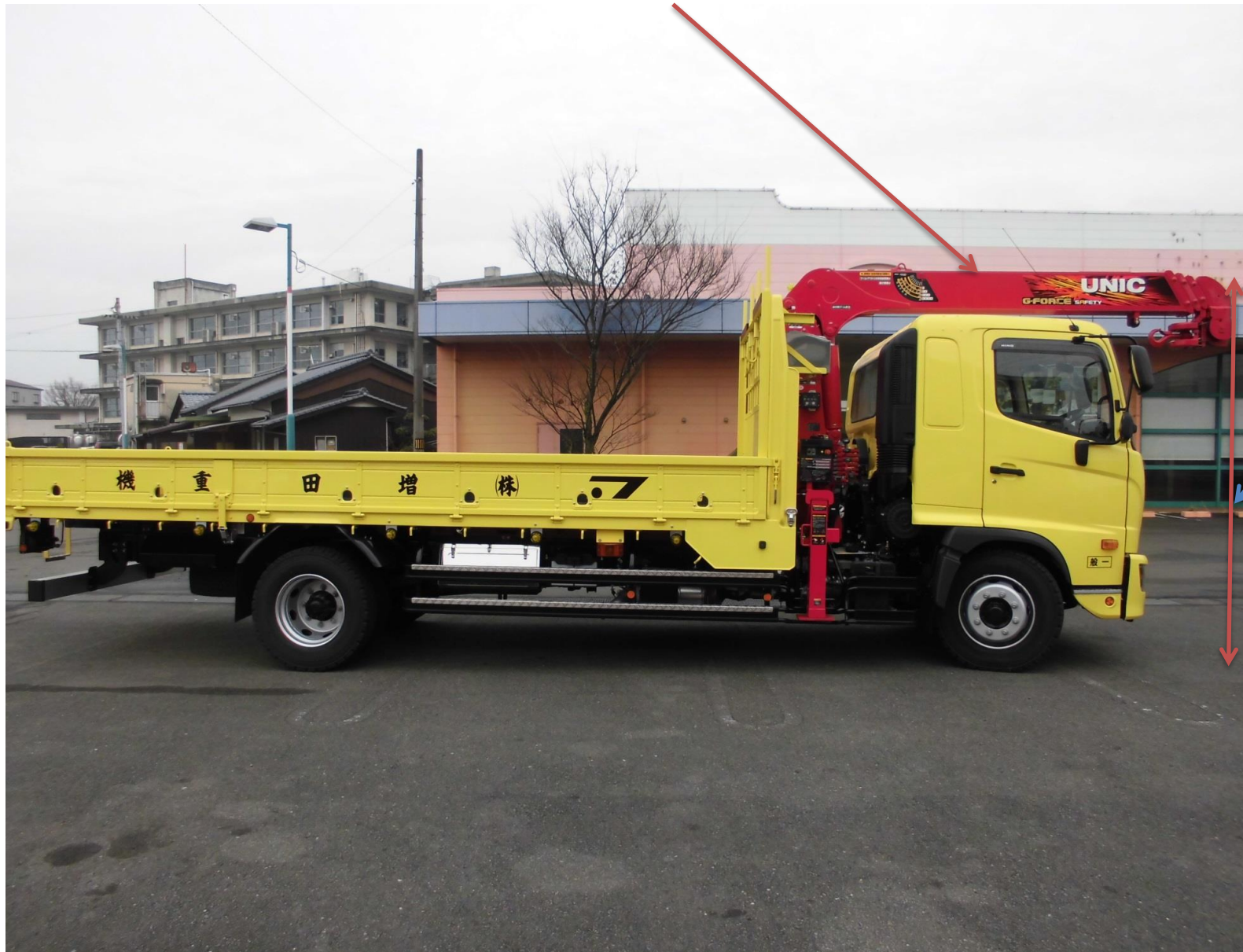
クレーン ユニック製2.9t吊り 4段boom ML(モーメントリミッター)警報型